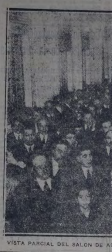
VISTA PARCIAL DEL SALON DE ACTOS DE LA CASA DEL PUEBLO AL COMENZAR EL GRAN MITIN

condó todos los campos del saber humano. Su acción decidida e infatigable sembró sin desfallecer un segundo día suerte de grandes principios y nobles ideas de renovación social. Como historiador, como tribuno, como pensador, como educacionista, como periodista, como artista, supo siempre dejar la huella profunda e imperecedera de su genio. A su labor cíclopea hay que unir su vida de agitado, múltiple e inquieto, por lo que resulta imposible todo intento de sintetizar su vasta obra sin el grave riesgo de ofrecerla desfigurada.